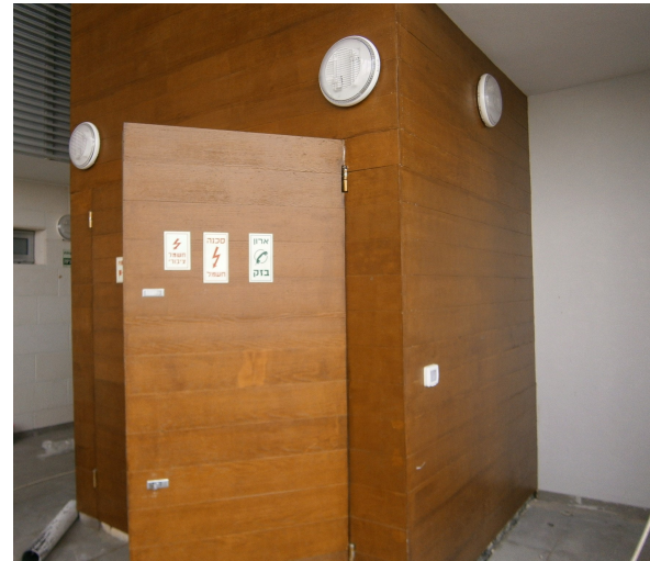
(תמונה להמחשה בלבד).